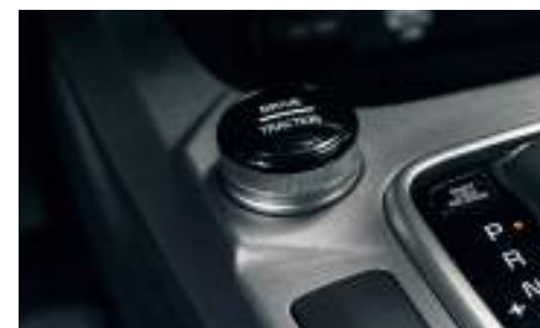
Grip Control o Selector de Terreno: Barro / Tierra / Nieve