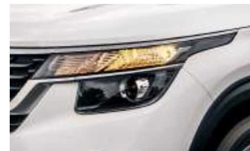
Faros delanteros: Halógenos Bifuncionales