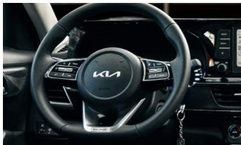
Volante Deportivo forrado en cuero