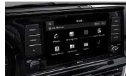
Central Multimedia 8" Inalámbrica con Android Auto/ Apple Car Play