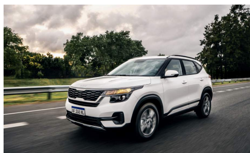
Modos de Conducción: Eco / Normal / Sport