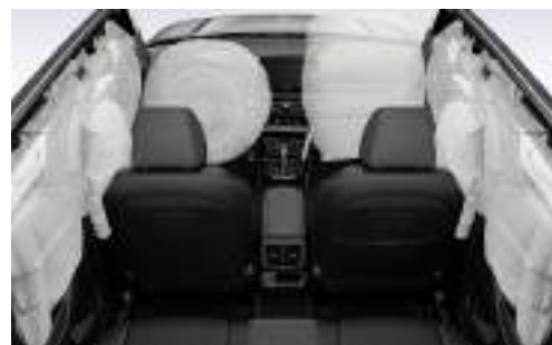
Seguridad: 6 Airbags / ABS- ESP - HAC