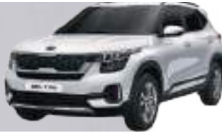
Perla Blanco Glaciar (GWP)