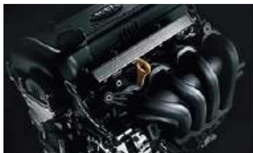
Motor: 1.6 / 123 cv / 154 NM