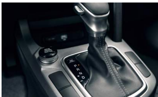
Caja: AT / 6 Vel / Convertidor de Par