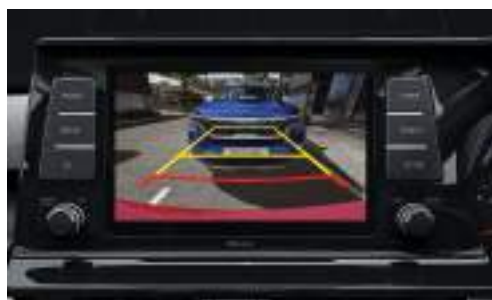
Camara de Retroceso con Sensores de Estacionamiento