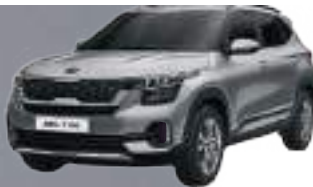
Gris Solemne (KDG)